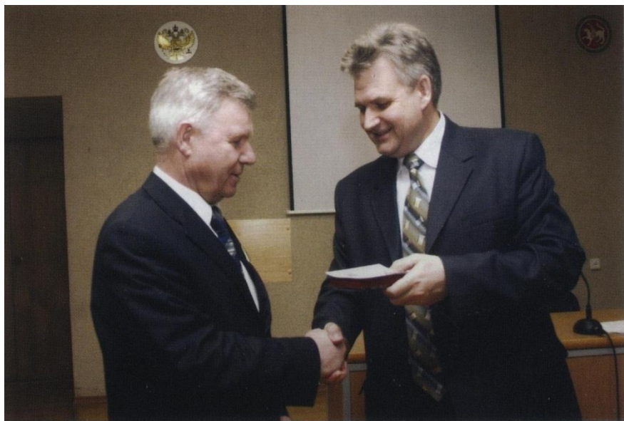
Татарстан Мәгариф һәм фән министры урынбасары Данил Мәхмүт улы Мостафин хөкүмәтебез бүлгән тапшыра.

Кеше булып калырга»,- дип яза ул «Гомер бит ул бер генә» дигән шигырендә. Рифкәт Нуруллович инде безнең арада юк. Тик халык күңелендә якты образы һәм матур эшләр-ре яши.