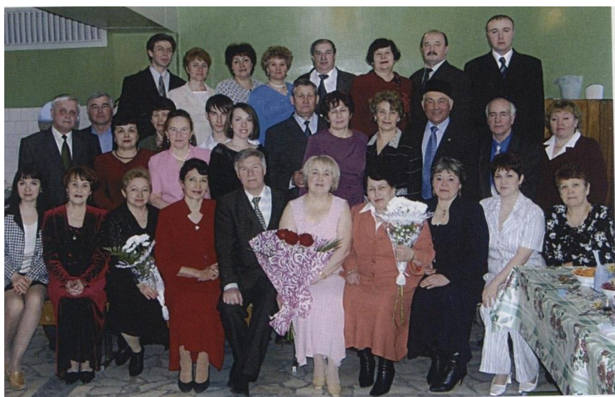
Р.Муллин 2 гимназия укытучылары арасында

Безгә көнбатыш технологиясен, көнчыгышның әхлагын бергә туплаган үзебезнең татар мәгариф системасы кирәк», - ди ул. Менә шуңа күрә дә шәхестә милли рух тәрбияләү өчен шартлар тудырырга тырыша, хезмәт тәрбиясенә зур әһәмият бирә: татар халкы тарихын, милли йолаларын, гаиләдәге милли тәрбияне, гарәп графикасы нигезләрен, төрек телен өйрәнүгә, рәсем һәм музыка дәресләрен милли үзенчәлекләр белән баetylган программалар буенча укытуга, татар теле һәм әдәбияты дәресләрендә сүз тәмен тоя белү алымнары өстендә эшләүгә басым ясарга, гимназиядә автодело, шахмат, ритмика кабинеты жиһазлауга, мили киёмнәр булдыруга, халкыбызның күренекле шәхесләре белән тыгыз элемтәдә торып эшләүгә әһәмият биреп эшли.